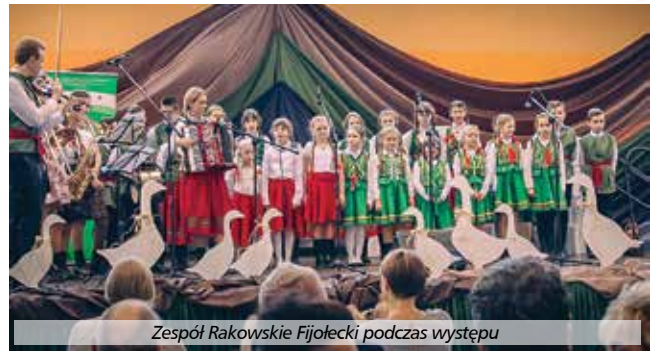
Zespół Rakowskie Fijołki podczas występu