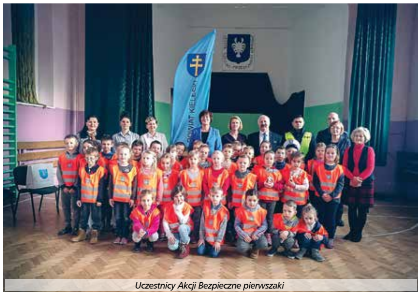
Uczestnicy Akcji Bezpieczne pierwszaki

Pierwszaki wysłuchały prelekcji o tym jak powinny się zachowywać na drodze jako piesi, poznały prawidłowy przebieg przechodzenia przez przejście dla pieszych oraz dowiedziały się jak ważne są dla bezpiecznego uczestniczenia w ruchu drogowym elementy