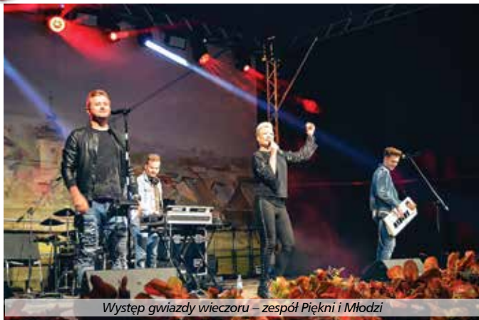
Występ gwiazdy wieczoru – zespół Piękni i Młodzi

trum Kultury i Sztuki w Połańcu, składający się z młodych utalentowanych dziewcząt wykonujących pod