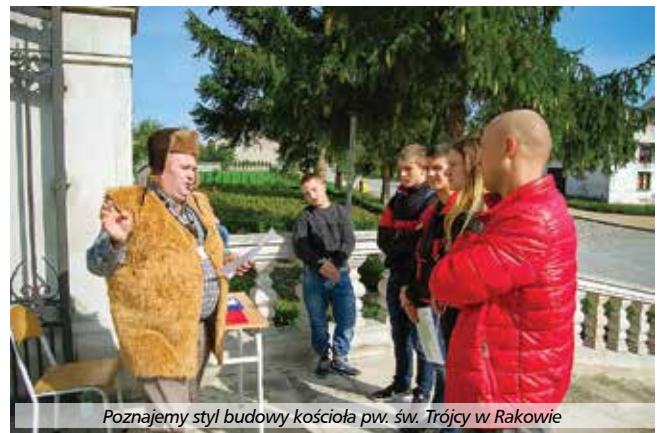
Poznajemy styl budowy kościoła pw. św. Trójcy w Rakowie

Na starcie na Rakowskim Rynku pojawiło się wraz z opiekunami 10 czteroosobowych zespołów pod własnymi kolorowymi sztandarami. W zabawie uczestniczyli uczniowie ze szkół podstawowych i gimnazjów z terenu powiatu kieleckiego, tj.: Gimnazjum w Łagowie, Szkoła Podstawowa w Łagowie, Szkoła Podstawowa im. Jana Pawła w Drugni, Gimnazjum w Rembowie, Szkoła Podstawowa w Rembowie Gimnazjum im. Jana Pawła w Rakowie, Zespół Szkolno – Przedszkolny w Rakowie, Szkoła Podstawowa w Ocieskach,