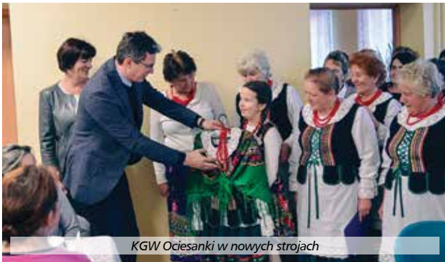
KGW Ociesanki w nowych strojach

Z dniem 31 października zakończono realizację w gminie Raków projektu pn. Szata nie zdobi, ale utożsamia – uszycie strojów ludowych dla Koła Gospodyń Wiejskich. Opiewał on na kwotę 15 980 PLN, w tym 9 787,75 PLN wkładu własnego Gminy Raków i 6 192,25 PLN uzyskanego dofinansowania w ramach konkursu Odnowa Wsi Świętokrzyskiej na 2017r. organizowanego przez Województwo Świętokrzyskie. Realizacja objęła uszycie 20 kompletnych strojów ludowych – po 10 dla każdego KGW. Po raz pierwszy panie z Koła Go-