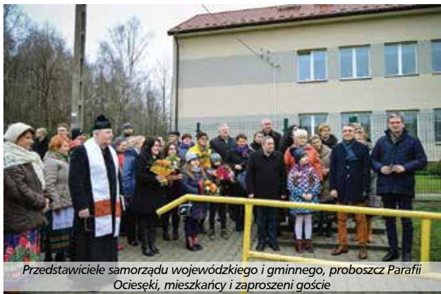
Przedstawiciele samorządu wojewódzkiego i gminnego, proboszcz Parafii Ocieskiej, mieszkańcy i zaproszeni goście

zaangażowanych w powstawanie tej inwestycji. Były kwiaty, podziękowania i piosenki przygotowane specjalnie na tę okazję przez Panie z KGW „Ociesanki”.