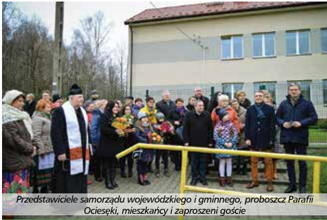
Przedstawiciele samorządu wojewódzkiego i gminnego, proboszcz Parafii Ocieskiej, mieszkańcy i zaproszeni goście

zaangażowanych w powstawanie tej inwestycji. Były kwiaty, podziękowania i piosenki przygotowane specjalnie na tę okazję przez Panie z KGW „Ociesanki”.