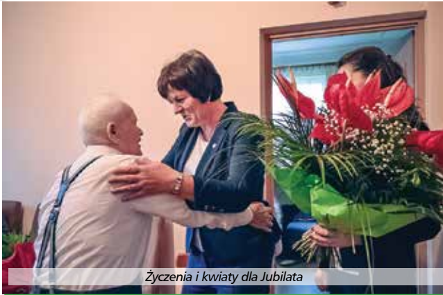
Zyczenia i kwiaty dla Jubilata

doczekał się 15 wnucząt, 20 prawnucząt i 1 praprawnuczki. W młodości wykazał się niezwykłą odwagą, walcząc z okupantem podczas wojny. Ponadto, Senior zaznaczył się w historii swojej miejscowości jako współzałożyciel OSP w Drogowlach, która była jedną z pierwszych powojennych jednostek w Gminie Raków, działacz ZBoWiD, organizator wielu zbiórek i prac społecznych, a nawet wydarzeń kulturalnych.