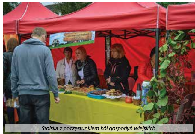
Stoiska z poczęstunkiem kół gospodyń wiejskich