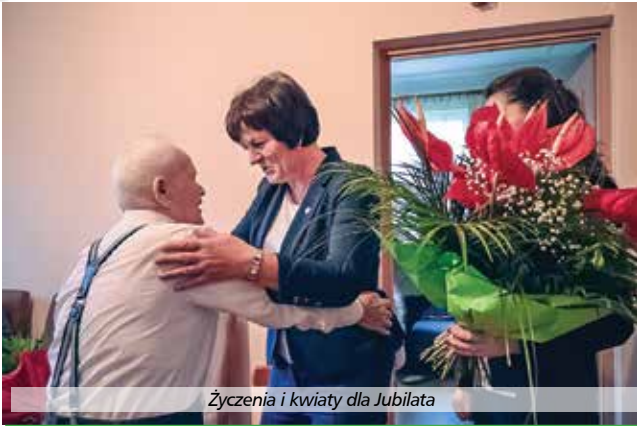
Zyczenia i kwiaty dla Jubilata

doczekał się 15 wnucząt, 20 prawnucząt i 1 praprawnuczki. W młodości wykazał się niezwykłą odwagą, walcząc z okupantem podczas wojny. Ponadto, Senior zaznaczył się w historii swojej miejscowości jako współzałożyciel OSP w Drogowlach, która była jedną z pierwszych powojennych jednostek w Gminie Raków, działacz ZBoWiD, organizator wielu zbiórek i prac społecznych, a nawet wydarzeń kulturalnych.