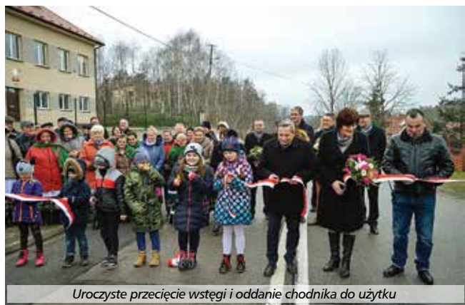
Uroczyste przecięcie wstęgi i oddanie chodnika do użytku

W ramach inwestycji pn. „Budowa chodnika w ciągu drogi wojewódzkiej nr 764 w miejscowości Ocieski” wykonano chodnik o szerokości 1,5-2,0 m na długości 838,62 m, zatokę autobusową z wiatą przystankową, wymieniono przepusty pod zjazdami, zamontowano poręcze dla osób niepełnosprawnych, wybudowano bariery sprężyste oraz bariery wyposażone w porę-