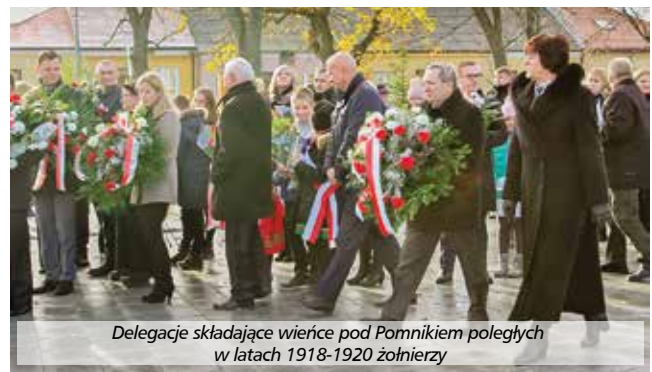
Delegacje składające wieńce pod Pomnikiem poległych w latach 1918-1920 żołnierzy