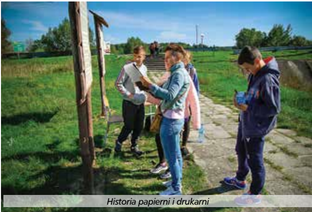
Historia papierni i drukarni