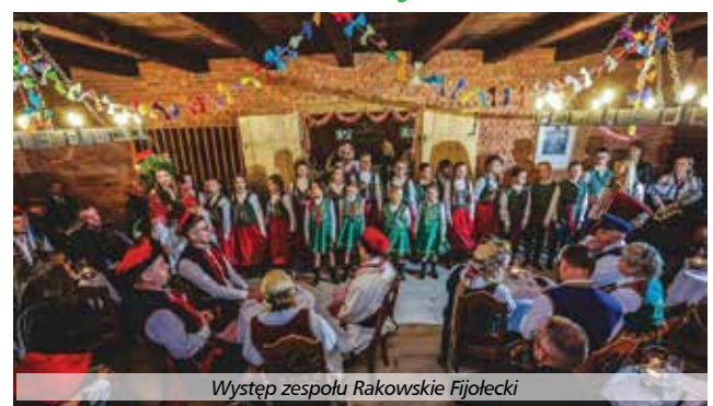
Występ zespołu Rakowskie Fijołki

Inicjatywie tej towarzyszył zespół Rakowskie Fijołki. Swoją grą i śpiewami rozbawiał uczestników za-