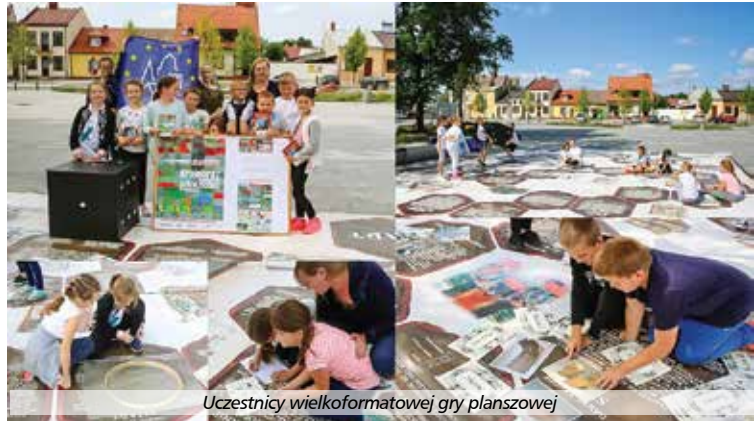
Uczestnicy wielkoformatowej gry planszowej

W dniu 17 listopada 2017 roku podczas uroczystej gali w Opolu odbyło się przyznanie nagród dla organizatorów wydarzeń w ramach jubileuszowej 25. edycji Europejskich Dni Dziedzictwa. Wyróżniono 82 orga-