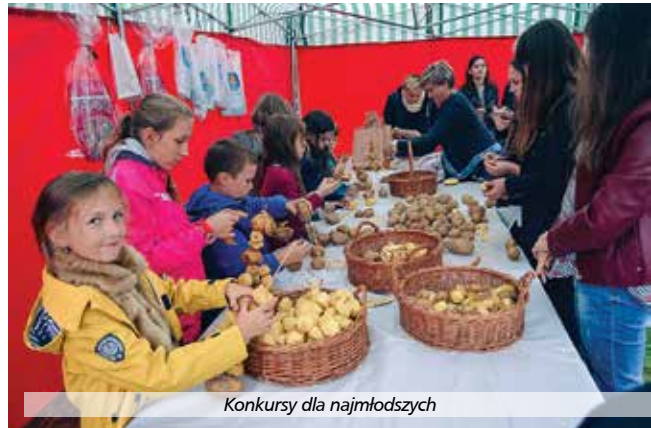
Konkursy dla najmłodszych

Atrakcją były również konkursy z ziemniakiem w roli głównej. Nagrody ufundowane zostały przez Marszałka Województwa Świętokrzyskiego, Starostę Powiatu Kieleckiego oraz Wójta Gminy Raków. Adresowane były do Kół Gospodyń Wiejskich, młodzieży i dzieci.