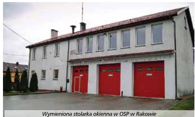
Wymieniona stolarka okienna w OSP w Rakowie

Uzyskane środki pozwoliły na remont budynku Ochotniczej Staży Pożarnej w Rakowie, który pełni funkcje społeczno-kulturalne. Renowacja polegała na wymianie stolarki okiennej w liczbie 33 sztuk wraz z ich