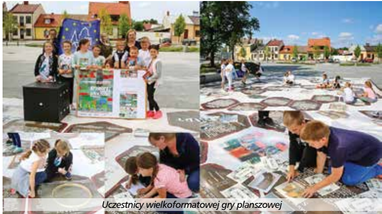
Uczestnicy wielkoformatowej gry planszowej

W dniu 17 listopada 2017 roku podczas uroczystej gali w Opolu odbyło się przyznanie nagród dla organizatorów wydarzeń w ramach jubileuszowej 25. edycji Europejskich Dni Dziedzictwa. Wyróżniono 82 orga-