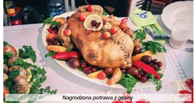
Nagrodzona potrawa z gęsiny