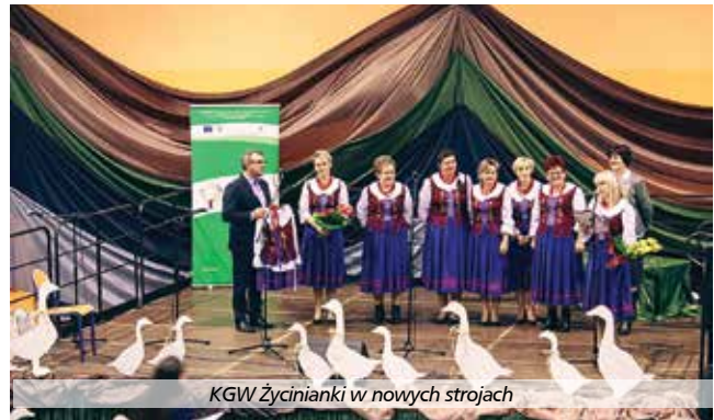
KGW Życinianki w nowych strojach

Z dniem 31 października zakończono realizację w gminie Raków projektu pn. Szata nie zdobi, ale utożsamia – uszycie strojów ludowych dla Koła Gospodyń Wiejskich. Opiewał on na kwotę 15 980 PLN, w tym 9 787,75 PLN wkładu własnego Gminy Raków i 6 192,25 PLN uzyskanego dofinansowania w ramach konkursu Odnowa Wsi Świętokrzyskiej na 2017r. organizowanego przez Województwo Świętokrzyskie. Realizacja objęła uszycie 20 kompletnych strojów ludowych – po 10 dla każdego KGW. Po raz pierwszy panie z Koła Go-