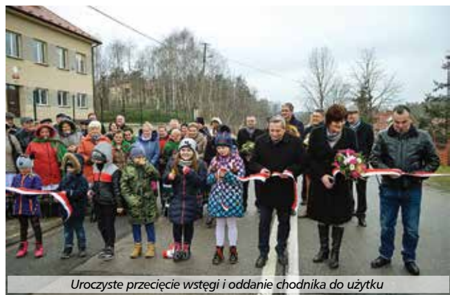
Uroczyste przecięcie wstęgi i oddanie chodnika do użytku

W ramach inwestycji pn. „Budowa chodnika w ciągu drogi wojewódzkiej nr 764 w miejscowości Ocieski” wykonano chodnik o szerokości 1,5-2,0 m na długości 838,62 m, zatokę autobusową z wiatą przystankową, wymieniono przepusty pod zjazdami, zamontowano poręcze dla osób niepełnosprawnych, wybudowano bariery sprężyste oraz bariery wyposażone w porę-