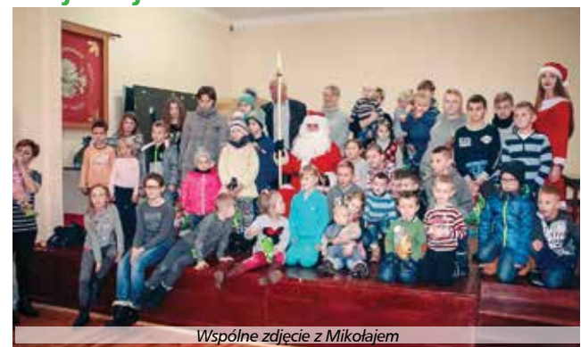
Wspólne zdjęcie z Mikołajem