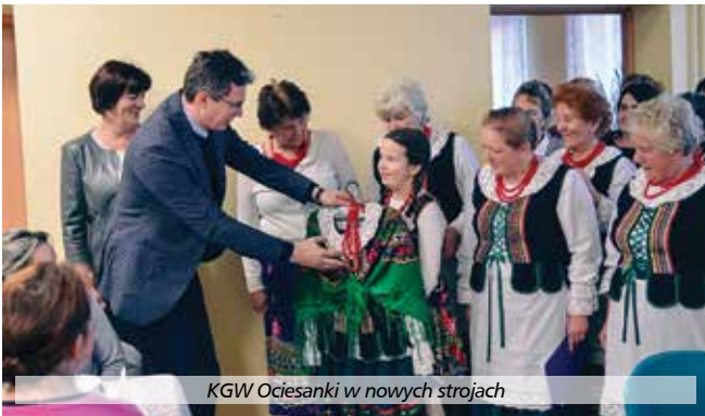
KGW Ociesanki w nowych strojach

Z dniem 31 października zakończono realizację w gminie Raków projektu pn. Szata nie zdobi, ale utożsamia – uszycie strojów ludowych dla Koła Gospodyń Wiejskich. Opiewał on na kwotę 15 980 PLN, w tym 9 787,75 PLN wkładu własnego Gminy Raków i 6 192,25 PLN uzyskanego dofinansowania w ramach konkursu Odnowa Wsi Świętokrzyskiej na 2017r. organizowanego przez Województwo Świętokrzyskie. Realizacja objęła uszycie 20 kompletnych strojów ludowych – po 10 dla każdego KGW. Po raz pierwszy panie z Koła Go-