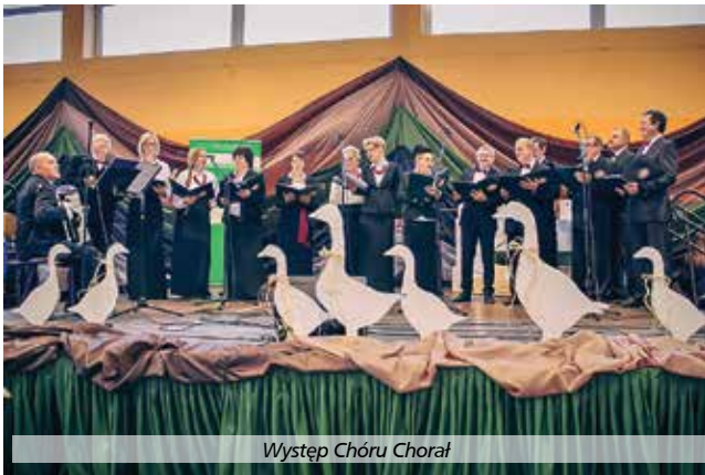
Występ Chóru Chorał

...Skąd swój pożytek biorą gospodarze starzy: i mięso i praktykę jeśli się im zdarzy widzieć makuły śniade kości obnażystej, spodziewają się pewnie zimy oparzystej Jeśli też rydzowata, z brzegów zapalona, zapewne zima będzie przykra i szalona Będzie li też bielizny miała w sobie wiele, niepochybna stateczność sanice się ściela.”