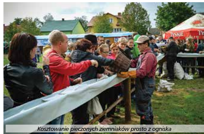
Kosztowanie pieczonych ziemniaków prosto z ogniska