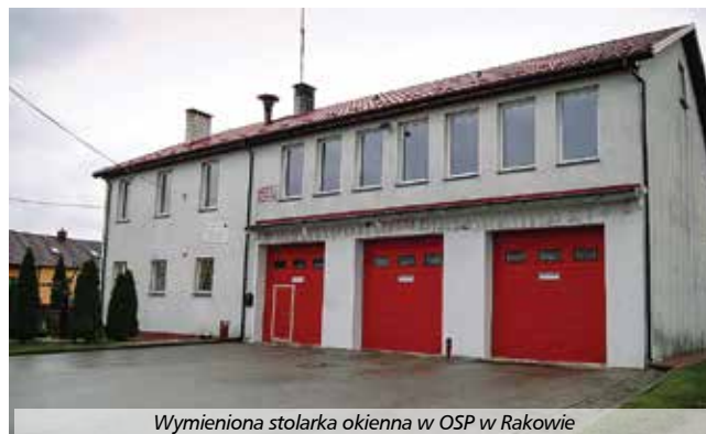
Wymieniona stolarka okienna w OSP w Rakowie

Uzyskane środki pozwoliły na remont budynku Ochotniczej Stacji Pożarnej w Rakowie, który pełni funkcje społeczno-kulturalne. Renowacja polegała na wymianie stolarki okiennej w liczbie 33 sztuk wraz z ich