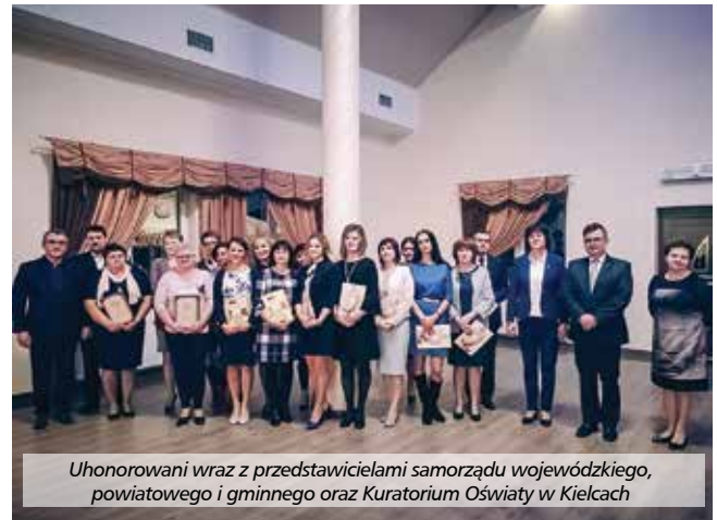
U honorowani wraz z przedstawicielami samorządu wojewódzkiego, powiatowego i gminnego oraz Kuratorium Oświaty w Kielcach

Po rozdaniu okolicznościowych listów gratula-